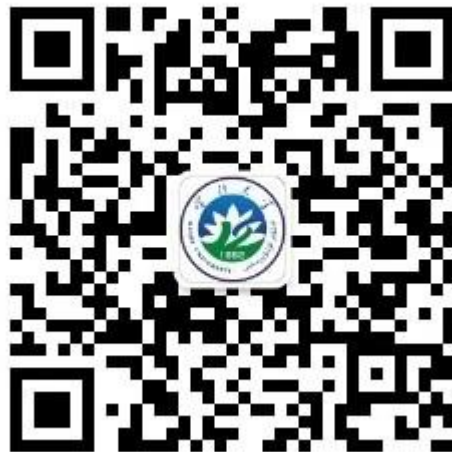
“云上喀大”公众号二维码